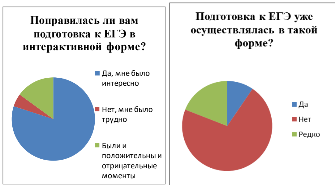
Рис. 2 – Результаты опроса участников эксперимента

Таким образом, результаты данного опроса свидетельствуют об успешности и универсальности такой интерактивной формы урока, как веб-квест. Использование таких типов интерактивных заданий, как установление соответствий, компиляция, проектирование, ввод текста были интересны большему количеству респондентов. Следовательно, применение интерактивных методов и технологий в дистанционном обучении может быть достаточно привлекательным для обучающихся, вопрос эффективности требует отдельного сопоставительного исследования.