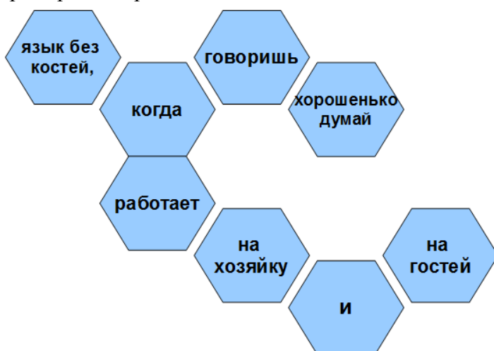
Рисунок 3. Урок ОНЗ. Закрепление. Задание 1.

Примерный вариант такого задания может выглядеть следующим образом: