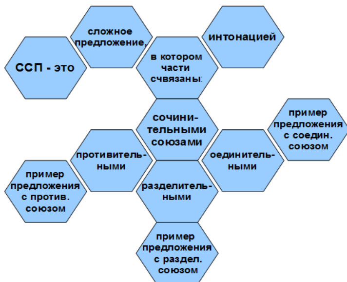
Рисунок 1. Урок ОНЗ. Этап актуализации. Задание 1.

Один из типов урока — урок открытия нового знания. «Шестиугольный» метод обучения здесь можно применить как на этапе актуализации знаний, так и во время закрепления нового материала. К первому относятся те знания, которые необходимо актуализировать в памяти за счет анализа, синтеза, обобщения, сравнения, сопоставления, путем аналогий и прочих методов. К их числу можно отнести такие приемы, как постановка проблемных вопросов и ситуаций, включение разминок, введение различных игровых элементов (в том числе и интерактивных методов). Например, при переходе к изучению раздела «Сложноподчиненное предложение» необходимо актуализировать знания по теме «Сложносочиненное предложение». Для этого можно использовать задание следующего типа: