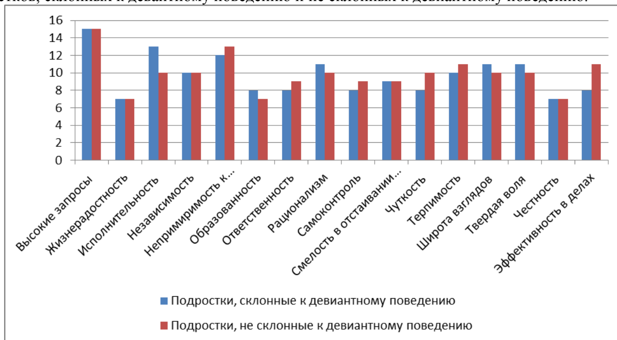
Рисунок 3. Средние значения рангов инструментальных ценностей по методике М. Рокича «Ценностные ориентации»

На рисунке 3 приведены средние значения рангов инструментальных ценностей подростков, склонных к девиантному поведению и не склонных к девиантному поведению.