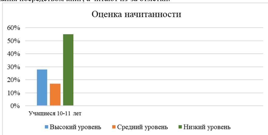
Рис. 2. Уровень начитанности младших школьников на констатирующем этапе эксперимента

В исследуемой группе преобладает низкий уровень начитанности – 82% учащихся (рис. 2) указали те книги, которые читали на уроках внеклассного чтения и те произведения, которые читали в учебнике. Только 1–2 человека, указали разнообразные книги. 18% третьеклассников имеют средний уровень, они указали книги, читаемые самостоятельно, и в классе. В основном дети указывали авторов и названия художественных произведений. В списках отсутствовала научно-популярная литература, что свидетельствует об отсутствии научной информации для расширения кругозора детей. Значительное место в перечнях учеников занимают произведения русских писателей: А. С. Пушкин, Н. Н. Носов, К. И. Чуковский, А. М. Волков, Л. Н. Толстой, И. П. Токмакова, В. В. Бианки. Но, так же дети указали и зарубежных авторов: С.Л. Клеменс (Марк Твен), Дж.К. Роулинг, К. Дикамилло, Дж.Ф. Родари, Х. Вебб, Дж. Боуэн, Р. Госинни. Исходя из указанных произведений и авторов, при самостоятельном чтении мало внимания уделяется научно-популярной литературе, чтению научных статей и журналов. Высокий уровень учебной мотивации свидетельствует о низкой начитанности и личностной мотивации, учащиеся не стремятся получить знания посредством книг, а читают из-за отметки.