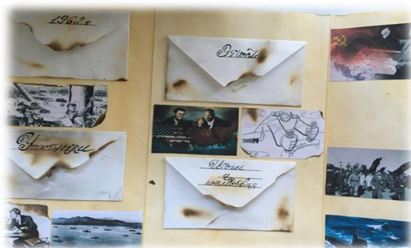
Рис. 2. Лэпбук «Карибский кризис»