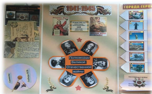
Рис. 3. Лэпбук «Великая Отечественная война»

В ходе обобщающего этапа были проанализированы данные, полученные на практическом этапе эксперимента. Экспериментальная работа позволяет сделать вывод о том, что у учащихся из экспериментального класса по сравнению с контрольным классом повысилась мотивация (см. рис. 4).