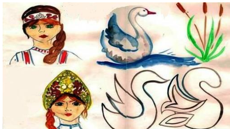
Рис. 3. Схематичное изображение славянского растительного орнамента «лебедушка»

Декоративная деятельность детей: украшение повязки орнаментом – рисование лебедушки, в подарок для мам. Особое внимание уделялось особенностям изображения лебедушки, через формирование умения рисовать элементы данного орнамента.