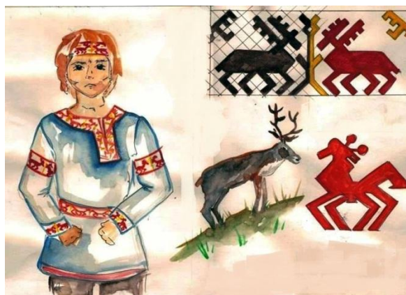
Рис.9. Пример стилизации русского орнамента «Олени»

Обучение детей рисованию данного элемента орнамента проходило с помощью трафарета.