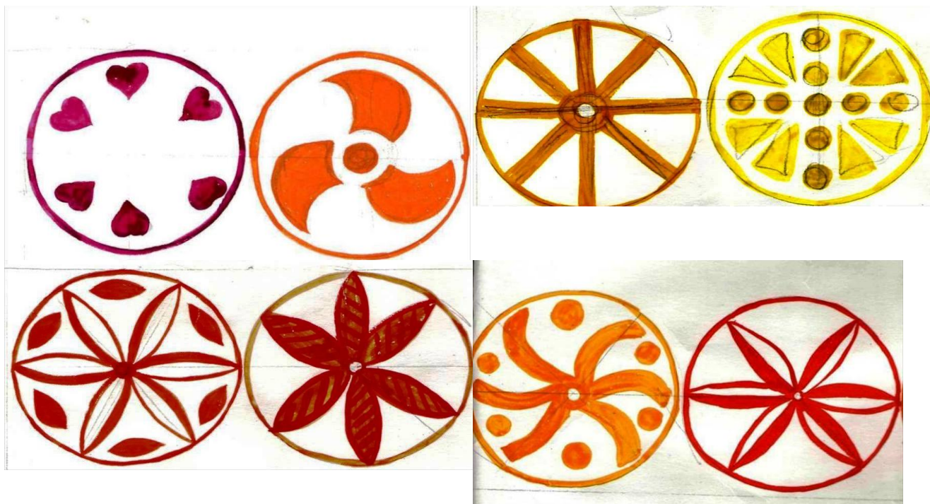
Рис. 1 Солярные знаки солнца, славянского орнаментального цикла

Декоративная деятельность детей: декоративное рисование знаков солнца. Детям предлагались полосы бумаги, на которых они изображали знаки солнца. Затем эти солнечные знаки вырезались, и детям предлагалось украсить ими кабинки или взять домой и повесить дома, как защиту от всего «нехорошего».