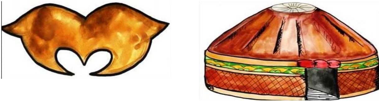
Рис. 8 Пример стилизации зооморфного алтайского орнамента «Голова барана»