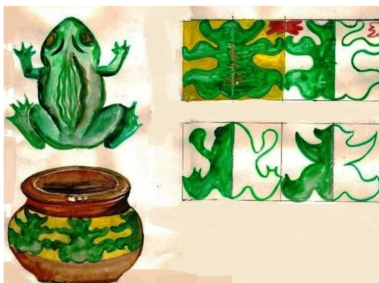
Рис. 10. Северодвинский орнамент «лягушка»

отпечаток на второй половине. Затем тонкой кисточкой дети прорисовывали детали лягушки. Вырезали её и украшали уголок природы.