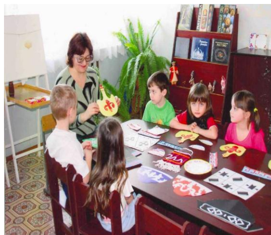
Фото 2. Занятия студии «Знаки и узоры орнаментов народов Алтая»