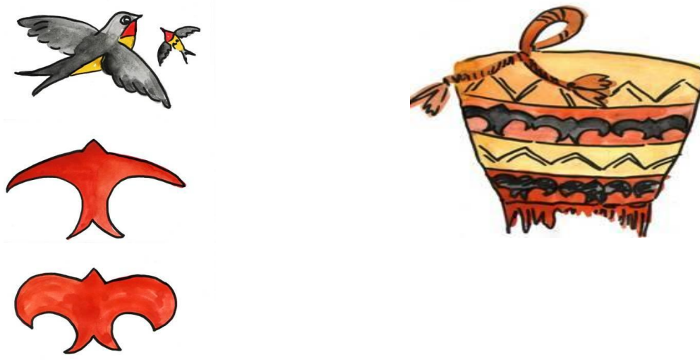
Рис. 4 Пример стилизации алтайского зооморфного орнамента «ласточки»

Декоративная деятельность детей: украшение праздничного платья Чейныш орнаментом – рисование ласточки. Особое внимание так же уделялось особенностям изображения ласточки, через формирование умения рисовать элементы данного орнамента.