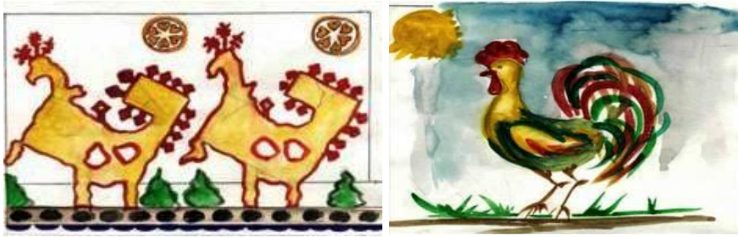
Рис. 2 Схематичное изображение славянского зооморфного орнамента «петушок»