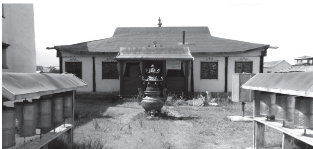
Рис. 7. Цилиндры маны

ен второй субурган. Вдоль образовавшейся дороги «высокий путь» к новому временному главному храму установили цилиндры маны с заложенными внутрь мантрами (рис. 7). Для буддистов каждое круговращение цилиндра (колеса, барабана) маны равняется прочтению молитв, вложенных в него.