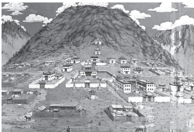
Рис. 1. Вид на монастырь Дээд хурээ. Картина из фондов краеведческого музея Архангайского аймака, г. Цэцэрлэг

Выдающийся русский востоковед А.М. Позднеев, побывавший здесь в 1892 году, писал: «...как при первом общем взгляде на старую и вместе главную часть монастыря, так и при более подробном ознакомлении с нею сразу бросается в глаза стремление основателя этого монастыря Лувсанпринлая пересадить на халхасскую почву Тибет... Архитектура всех главнейших кумирен его старого тибетского стиля, построенные в два и три этажа, они во многом напоминают собою, особенно издали, постройки европейских двухэтажных зданий» [5].