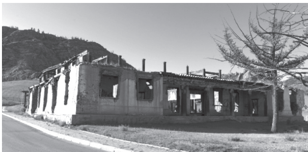
Рис. 4. Руинированное здание Цогчин дугана, соборного храма монастыря

Слева от Лаврана расположено то, что осталось от главного соборного храма монастыря Цогчин дугана, построенного в 1706 году (рис. 4).