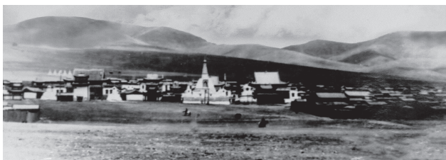
Рис. 8. Монастырь Хан Ундур. Фото середины 1920-х годов из частного архива

Трагична судьба монастыря Хан Ундур (рис. 8) в Ихтамире. Это один из первых монастырей Центральной Монголии. Его основание связывают с сооружением религиозной школы Тогчин в 1679 году. К 1934 году в состав монастыря входило около 30 храмов и проживало более тысячи монахов.