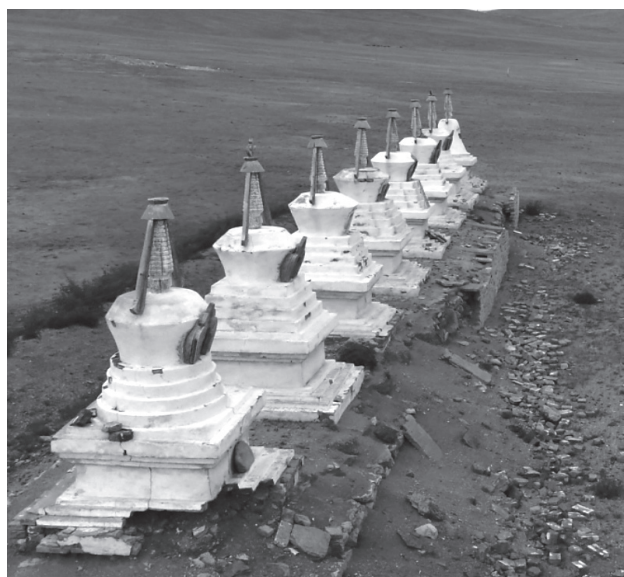
Рис. 10. Монастырь Хан Ундур. Восстановленные субурганы

О монастыре сегодня напоминают новоделы-субурганы на севере от руин. Подлинные ступы можно разглядеть на старом фото в левом северном углу. Новоделы тоже нуждаются в реставрации или хотя бы в примитивном ремонте оснований (рис. 10).