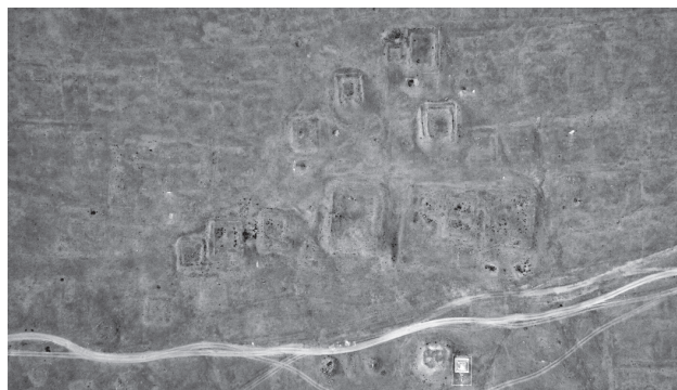
Рис. 9. Руины монастыря Хан Ундур. Аэрофотоснимок экспедиции

В 1939 году монастырь был разрушен. Сегодня только со 100-метровой высоты можно рассмотреть фундаменты храмов (рис. 9), которые изображены на архивной фотографии.