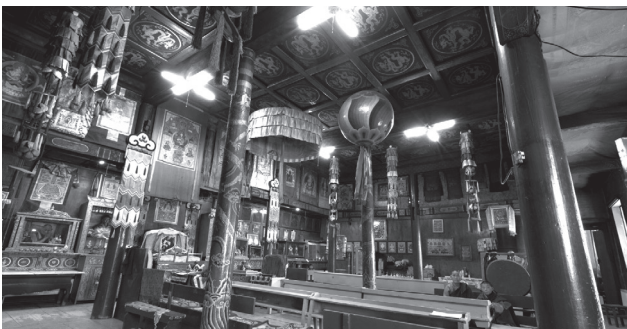
Рис. 5. Интерьер ныне действующего храма Сандун хувилган, переданного музеем буддийской общине Цэцэрлэга

Следует отметить, что после начала демократических преобразований в Монголии власти аймака и администрация музея относятся благосклонно к сохранению истории монастыря. Ей посвящён один из залов музея, хранящий многочисленные подлинные экспонаты. А когда в 1990 году во многих монастырях страны начала возрождаться религиозная служба, буддийской общине Архангайского аймака было передано для использования (рис. 5) одно из бывших богослужебных сооружений, в котором размещался музей истории религии.