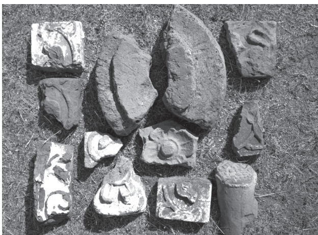
Рис. 12. Фрагменты декора разрушенных храмов Хан Ундур