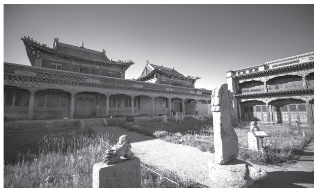
Рис. 3. Лавран. Внутренний дворик

Другим сохранившимся сооружением является Лавран (рис. 3) – резиденция Зая Пандиты Лувсанпринлая, не только религиозного деятеля, но и выдающегося монгольского просветителя, автора четырёхтомной энциклопедии «Тодорхой толь» («Ясное зеркало»). После жестоких репрессий 1930-х годов здание дворца было передано вначале городской пожарной команде, затем его приспособили под производственные помещения, склад алкогольной продукции, пищекомбинат. И только с начала 1960-х годов в Лавране разместился краеведческий музей, что позволило сохранить замечательные памятники архитектуры.