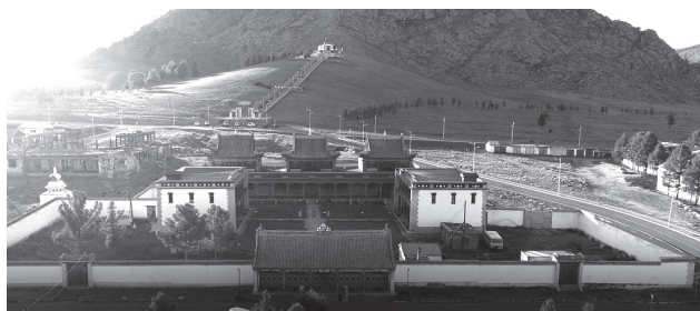
Рис. 2. Вид на монастырь Дээд хурээ. Аэрофотоснимок экспедиции, июль 2017 г.

храма-новодела принадлежит местному краеведческому музею и в настоящее время не доступно для посетителей.