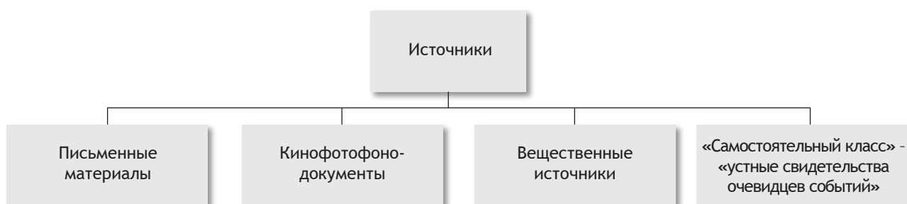
Рис. 2. Классификационная схема источников В.Т. Логиной

В 1970-е гг. появилось понятие «устные свидетельства». Оно стало применяться не к продуктам устного народного творчества (фольклору), а к записанной на аудионоситель информации об исторических событиях [19, с. 14]. Об этом говорит классификация В.Т. Логиной (см. рис. 2), который ввел термин «устные свидетельства очевидцев событий», которые как источники «в устном виде сохраняются непродолжительное время и после выявления исследователем фиксируются в виде письменной или магнитофонной записи» [19, с. 14].