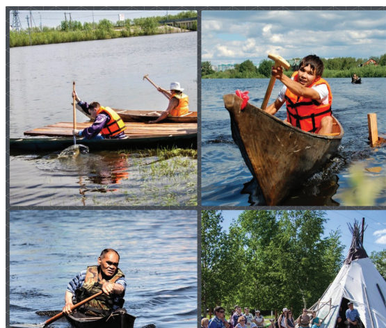
Рис. 3. На реке Сайме: День обласа, ХМАО – Югра, г. Сургут, 2015 г. 1