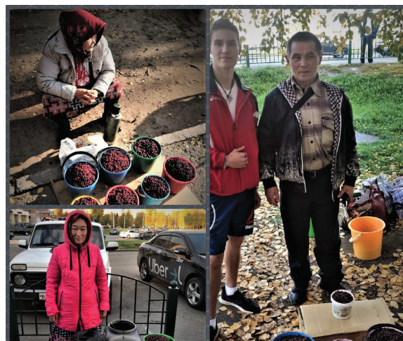
Рис. 1. Сентябрь: продажа брусники, ХМАО – Югра, г. Сургут, 2020 г.

Таким образом, представители современных индигенных сообществ Ханты-Мансийского автономного округа – Югры, проживающие на территориях Сургутского, Нижневартовского и Нефтеюганского районов, включены в систему жизненных процессов городского пространства Сургута. Антропологическое включенное наблюдение и работа «в поле» с информаторами, избранные как наиболее результативные приемы в рамках предложенной методологической парадигмы, позволили определить механизмы адаптации и нормы поведенческой культуры коренных народов в условиях города. Процессы кросс-культурного взаимодействия ханты и горожан, а в более широком контексте – ханты и города Сургута как объекта антропологического исследования, стоит проецировать на все городские локации Югры, поскольку технологии и стратегии коммуникации тождественны. Изучение опыта подобных взаимоотношений позволит корректировать существующие противоречия «коренного» и «пришлого» населения, объективно разрешать спорные ситуации в отношении территорий традиционного природопользования индигенных сообществ, преодолеть стереотипность сознания городских жителей к жизни ханты на родовых угодьях. Последующие исследования этнических групп и трансформаций их идентичности в городском пространстве предоставят возможность конструирования единой модели межэтнического и кросс-культурного взаимодействия, определяющей содержание северного города.