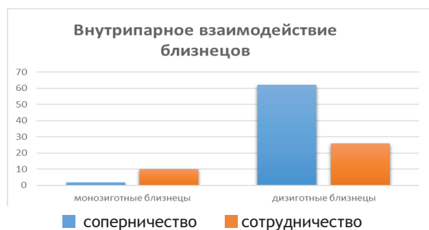
Рис. 2. Характер внутрипарного взаимодействия ди- и монозиготных близнецов

На следующем этапе исследования с целью выявления особенностей преобладания соперничества или сотрудничества в внутрипарном взаимодействии в парах ди- и монозиготных близнецов проведен сравнительный анализ (см. рис. 2).