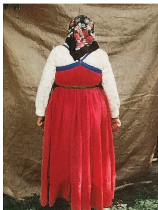
Рис. 6. Женщина, переселившаяся из южно-русской губернии, с. Владимировка, Славгородский р-н