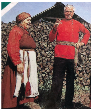
Рис. 1. Сибиряки-старожилы в традиционных костюмах, с. Солонешное