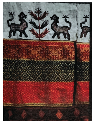
Рис. 7. Полотенце с традиционной вышивкой и подшитыми ткаными узорными полосками, Славгородский р-н