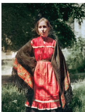
Рис. 2. Женский праздничный костюм нач. XX в. (юбка, кофта, фартук, шаль), Рубцовский р-н