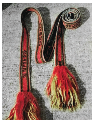
Рис. 5. Подарочный пояс с вытканной надписью, Восточно-Казахстанская обл.