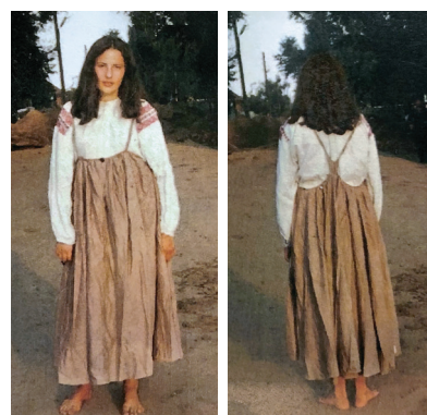
Рис. 4. Женщина в «круглом» сарафане и в рубашке с «прямыми поликами», с. Тогул (вид спереди и сзади)