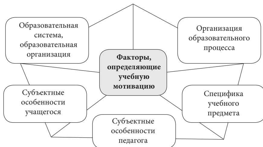
Рис. 2. Факторы, определяющие учебную мотивацию (составлено авторами на основе [19])

Как и любой другой вид мотивации, учебная мотивация определяется целым рядом специфических для этой деятельности факторов (см. рис. 2).