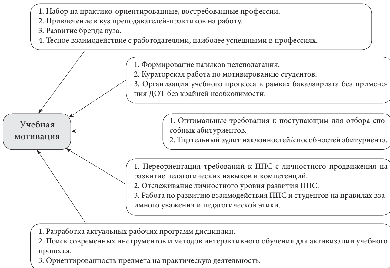
Рис. 5. Факторы, влияющие на учебную мотивацию (составлено авторами)

Рассмотрев в теоретической части исследования факторы, определяющие учебную мотивацию (см. рис. 2), выделим конкретные мероприятия в рамках всех пяти факторов, которые могут способствовать формированию и поддержанию учебной мотивации (см. рис. 5). Внедрение данных мероприятий в деятельность образовательных организаций поможет сформировать стойкую систему учебной мотивации обучающихся.