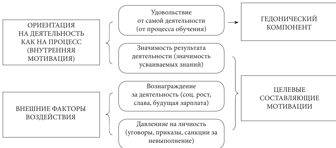
Рис. 1. Структура мотивации (составлено авторами на основе [18])

Первый структурный компонент условно назван «гедонической» составляющей мотивации, остальные три – ее целевыми составляющими. Вместе с тем первый и второй компоненты выявляют направленность, ориентацию на саму деятельность (ее процесс и результат), являясь внутренними по отношению к ней, а третий и четвертый фиксируют внешние (отрицательные