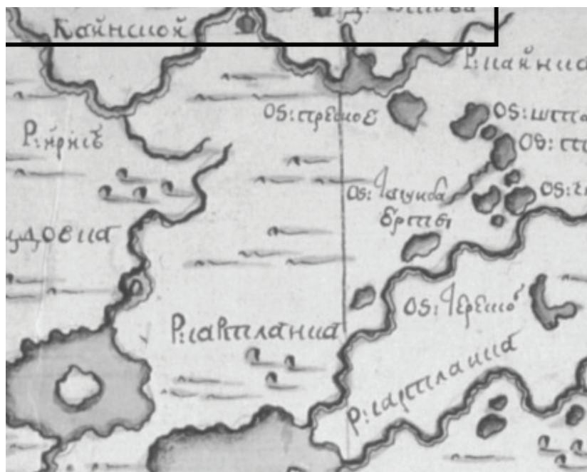
Рис. 2. Фрагмент карты некоторых частей Сибирской губернии 1765 г. Выделены населенные пункты на территории Томского уезда. РГВИА. Ф. 424. Оп. 1. Д. 28.