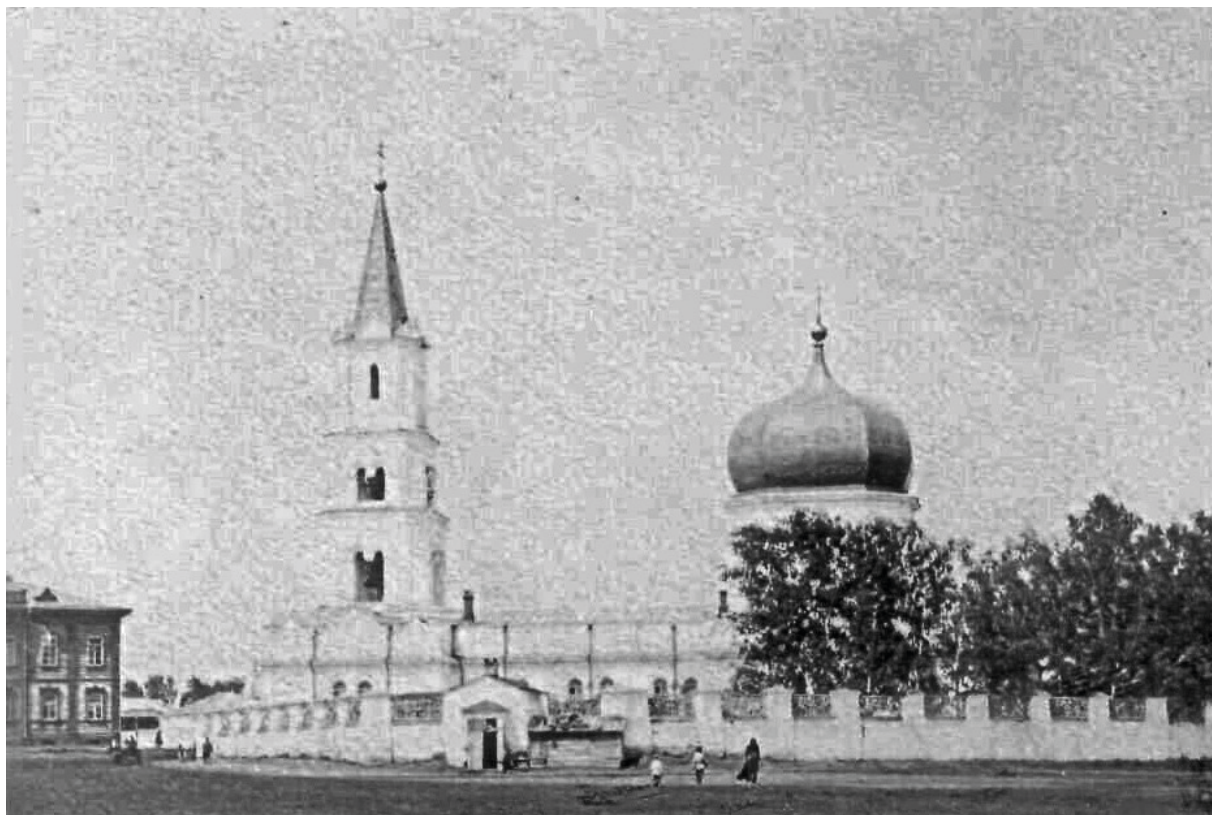
Рис. 1. Петропавловский собор в Барнауле (1771–74 гг., разрушен в 1935 г.).

В 1771 г. Барнаул посетил известный немецкий ученый Петр Симон Паллас. Он подтверждает, что в городе в основном деревянные здания (несколько каменных строений и около тысячи частных домов) и только одно каменное – аптека с садом, «в коем растут всякие травы», и амбарами. Паллас упоминает о наличии в Барнауле двух деревянных церквей и начале строительства (на месте бывшей третьей деревянной) «прекрасной каменной церкви, коя будет вся построена на новый вкус, и, чаятельно, месту сему немалую придаст красу» [3, с. 131]. Речь, конечно, идет о будущем Петропавловском соборе, который был заложен 23 июня 1771 г. (рис. 1).