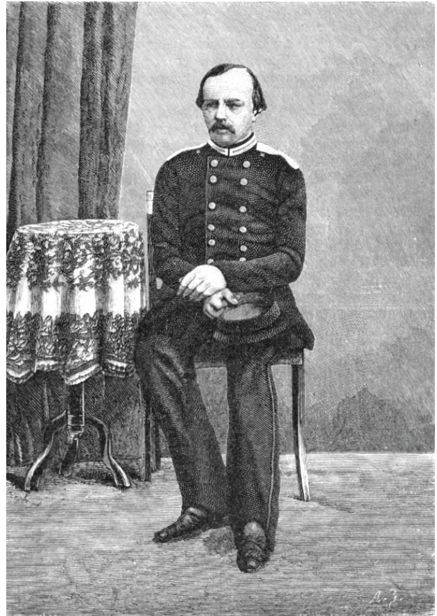
Федор Михайлович Достоевский. (Съ фотографіи, снятой въ Семипалатинскѣ въ 1858 г.).