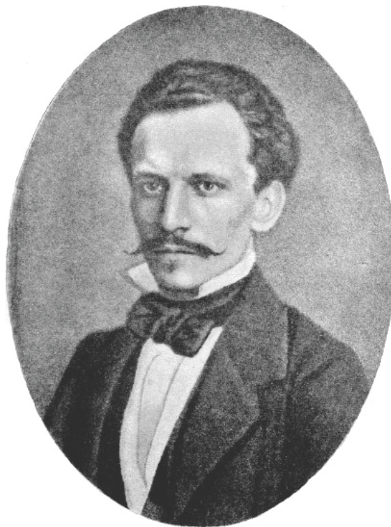
Рис. 4. П. П. Семенов (в будущем – Семенов-Тян-Шанский), 1854 г. [29, с. 9]

Одна из самых лестных литературных ассоциаций города – «Сибирские Афины» – принадлежит вышеупомянутому известному географу и путешественнику П. П. Семенову-Тян-Шанскому (рис. 4), который провел в Барнауле гораздо больше времени, чем Достоевский (он даже снимал здесь квартиру). П. П. Семенов противопоставлял Барнаул Омску, отождествлявшемуся им, наоборот, со Спартой, за грубость и воинственность нравов. Барнаул же, по мнению ученого, отличался более высоким уровнем культуры [38, с. 56–57] (ср.: [17, с. 190]). Хотя при этом он оговаривался, что оба сибирских города далеки от античных эталонов: Омск не имел «спартанской чистоты и безупречности», а Барнаул обладал «темными сторонами», позволявшими интеллигентному и культурному обществу жить выше средств, предоставляемых ему «скудным казенным жалованьем» [38, с. 126].