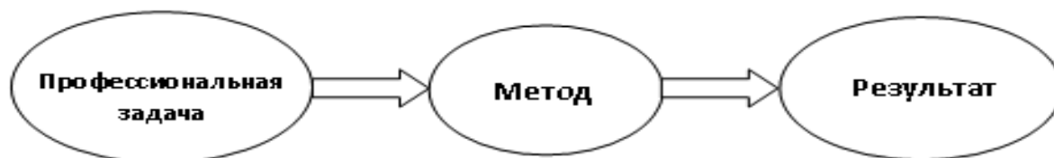
Рис. 2. Структура технологического шага

нальное действие, вызывающее ожидаемую динамику педагогической системы в заранее известном диапазоне» [6, с. 163]. Структура определенного таким образом технологического шага представлена на рисунке 2.