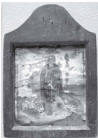
Рис. 6. Святой преподобный Герасим Иорданский. Хромолитография. Конец XIX – начало XX вв.

данная технология применимо к производству икон, давая огромные возможности в копировании иконописного образца, вместе с тем, при всех своих технических возможностях, профанировала идею иконописного образа, акцентировала внимание на поверхностности и декоративности, в ущерб глубине и одухотворенности. По сути, она отрицала собой православное понимание иконы. А широчайшая популярность и востребованность такого рода продукции, даже в среде духовенства, ясно указывала на огромные изменения, произошедшие в массовом сознании. Кроме того, подобные жестяные иконы оказались недолговечными: в случае утраты красочного слоя, что происходит довольно быстро, особенно в условиях повышенной влажности, они практически не подлежат реставрации. Таким образом, встал вопрос о благоговейном отношении к святыне, непригодной к использованию по назначению. В настоящее время жестяные иконы в хорошем состоянии уже встречаются достаточно редко (рис. 8). Жестяные иконы могут быть атрибутируемы по знаку торговой марки, размещавшемуся обычно на боковой поверхности.