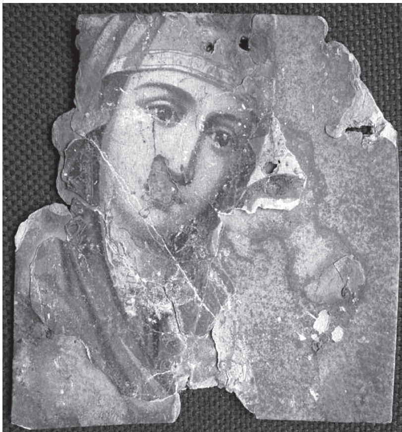
Рис. 1. Пресвятая Богородица. Фрагмент хромолитографии. Конец XIX – начало XX вв.

Некоторые предметы совсем не имеют легенды, то есть совершенно неизвестны имена владельцев, обстоятельства и место их приобретения и бытования. В случае плохой сохранности для таких икон крайне сложно установить точное время и место напечатания, а иногда даже определить изображение по сюжету (для фрагментов) (рис. 1).