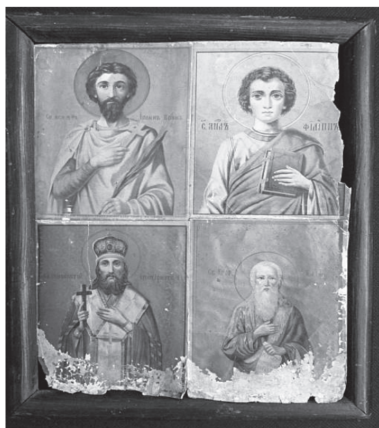
Рис. 3. Слева направо, сверху вниз: святой мученик Иоанн Воин (1897 г.), святой апостол Филипп, святитель Иннокентий Иркутский, святой пророк Божий Илия. Хромолитографии. Конец XIX – начало XX вв.

Святитель Феодосий Углицкий. 35,4x30,3x4,3 см. (рис. 3). Хромолитографическое изображение наклеено на внутреннюю поверхность киота (стекло утрачено), покрыто лаком. Боковые поверхности киота (имитация лузги) декорированы фольгой с рельеф-