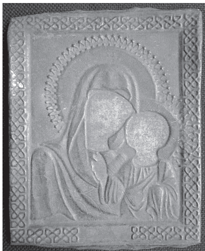
Рис. 8. Богоматерь Казанская. Хромолитография по жести. Конец XIX – начало XX вв.

готового оклада не было, предпринимались попытки самостоятельно декорировать внутреннюю поверхность киота (рис. 4). Чаще всего на обратной стороне киотов или на досках, к которым приклеивались хромолитографии, были специальные крепления для подвешивания. Среди домашних икон преобладали небольшие по размеру, о чем свидетельствует приведенный выше список. Зафиксированы случаи, когда именные иконы святых покровителей членов семьи (возможно, просто особо чтимых святых) вставлялись в одну общую раму (рис. 2, 3). В целом зафиксированные способы убранства хромолитографических икон совершенно аналогичны традиционному убранству живописных икон.