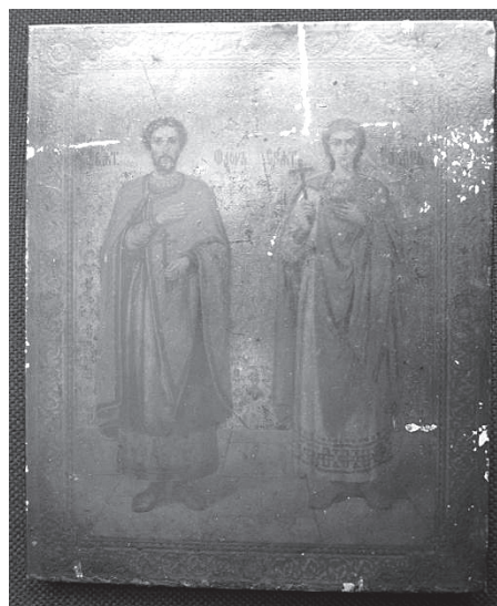
Рис. 7. Святые мученики Флор и Лавр. Хромолитография по жести. Конец XIX – начало XX вв.

В данном случае из-за плохой сохранности нельзя определить место и точное время напечатания икон.