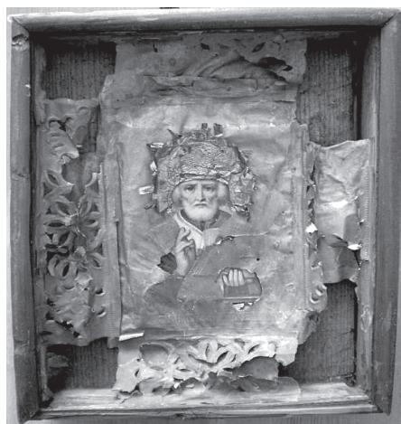
Рис. 9. Святитель Николай Мирликийский. Хромолитография. Конец XIX – начало XX вв.

озного быта России XIX – начала XX вв. В этот период хромолитографические изображения не только появляются в домашних иконостасах всех слоев населения, но становятся частью церковного убранства. Возможность использования в православном обиходе тиражированного священного изображения поставила на повестку дня вопросы, которые столь же актуальны в наше время, как и век назад. С одной стороны, вне всякого сомнения находится святость и неизбежность традиционного представления об иконе. И совершенно ясно, что это представление не может и не должно меняться в угоду духа времени. С другой стороны, существует тиражированная икона как явление нашей повседневности. Изучение истории и разных аспектов этого явления, в котором может помочь музейная коллекция хромолитографий, также представляется важным и актуальным.