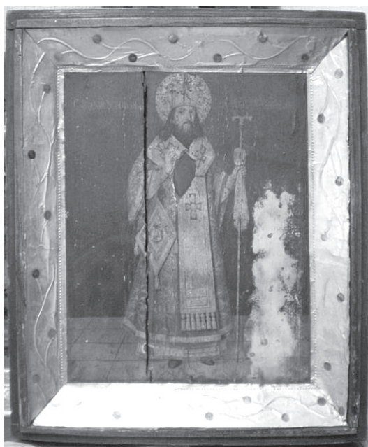
Рис. 4. Святитель Феодосий Углицкий. Хромолитография. Конец XIX – начало XX вв. Хромолитографии. Конец XIX – начало XX вв.

Святой преподобный Герасим Иорданский (рис. 6). 15x23,3x1,5 см. Хромолитография. На обратной стороне изображения напечатано краткое житие св. прп. Герасима с пояснением, что настоящее изображение является благословением обители святого преподобного Герасима и настоятеля Серапиона на Иордани. Помещена в деревянную рамку под стекло. Село Пещерка Залесовского района Алтайского края. Поступление – 1998 г.