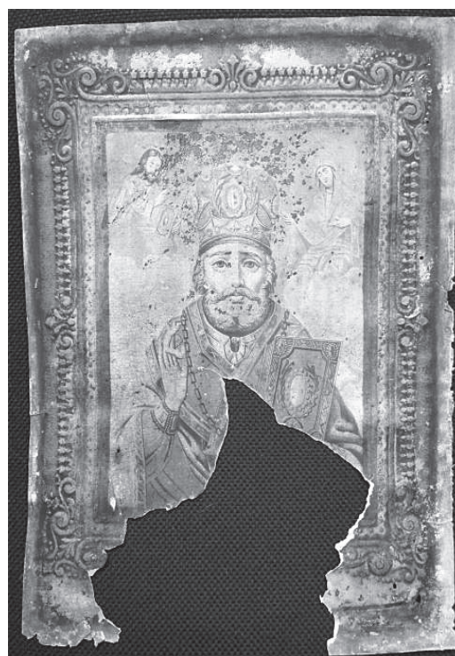
Рис. 2. Святая равноапостольная Мария Магдалина (слева). Хромофотография. 1884 г. Святитель Николай Мирликийский (справа). Хромофотография. Конец XIX – начало XX вв.